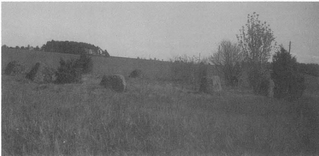
Jättedansen (R1) Den östra domarringen på Storegården. Skebyåsen i bakgrunden. 1955